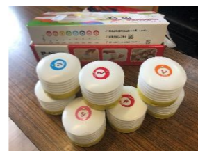
手で圧力をかけると音が出ます。